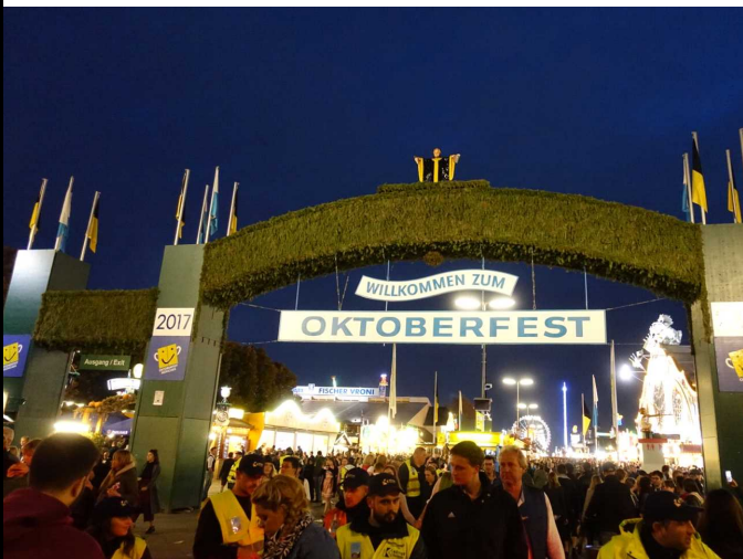
독일 옥토버페스트 축제