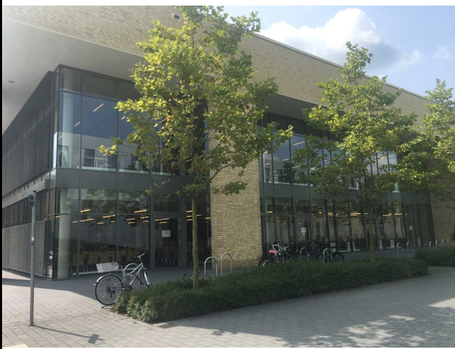
학교 식당 건물