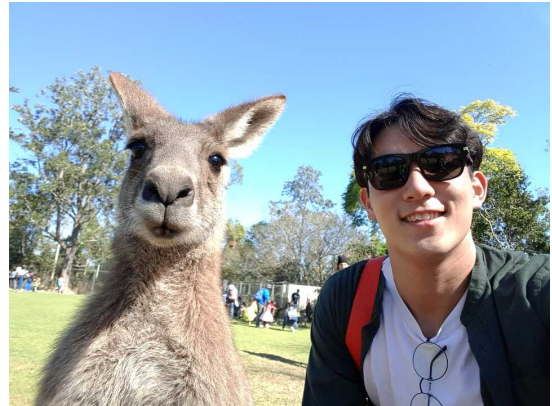
론파인 파크에서 캥거루와